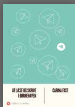
At læse og skrive i børnehaven Carina Fast

- Vi er nok også blevet mere opmærksomme på det medie, vi skriver i, hvilken skrifttype og hvilke tegn vi bruger, når vi skriver. Hvis vi eksempelvis glemmer spørgsmålstegnet i sms'en virker den uforpligtende, og så kan det være, at vi aldrig får et svar tilbage, slutter hun.