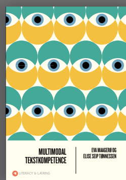
Multimodal tekstkompetence Eva Maagerø & Elise Seip Tønnessen