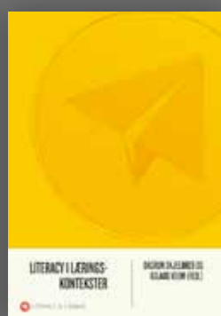
Literacy i læringskontekster Dagrun Skjelbred & Aslaug Veum (red.)