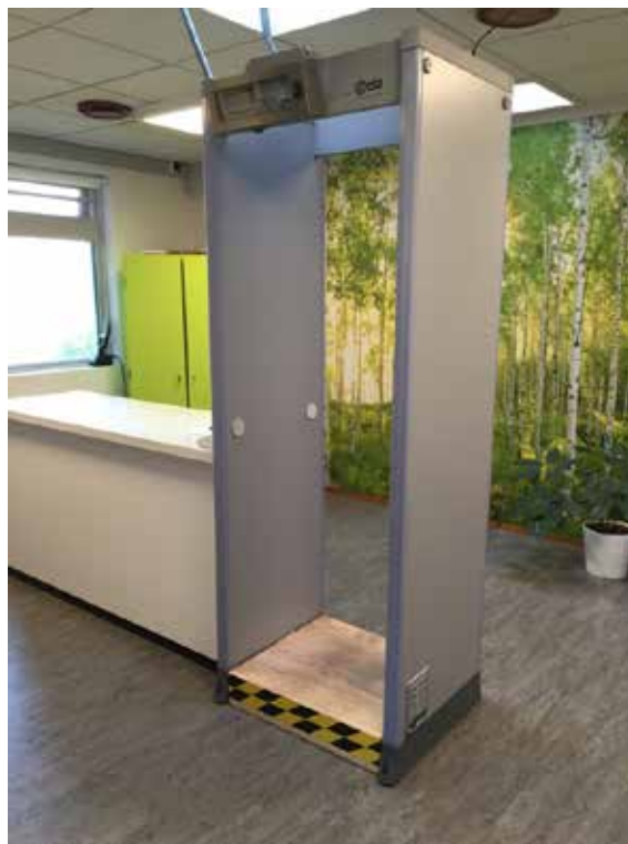
Snaplog fra arrest

klaret mit ærinde og ventet på en godkendelse. Døren lukker bag mig, og klikket fortæller mig, at den igen er låst. Det er lidt mærkeligt at være låst inde. Det næste, der møder mig, er en metal-detektor.