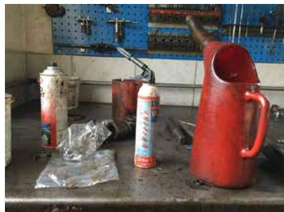
Snaplog fra autoværkstedet

Den lokale mekanikers handlinger kan på ingen måde sammenlignes med farens handlinger i værket, hvilket bestemt heller ikke er hensigten med den stedbaserede tilgang – at måle fortælleunivers mod virkelighed. Derimod er hensigten med den stedbaserede tilgang at forstå og kende stederne og deres egenskaber for at kunne sætte sig i den andens sted med værket.