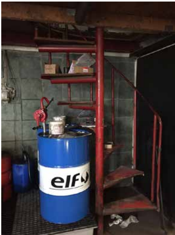
Snaplog fra autoværkstedet