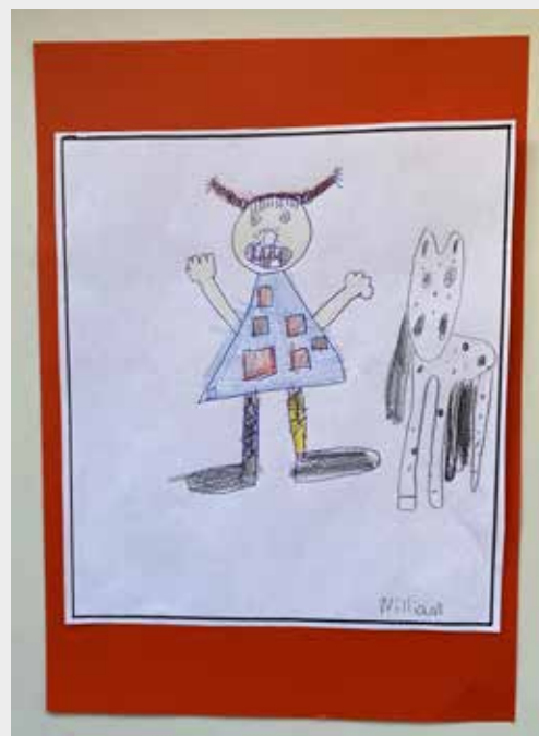
Billede 1: Eleverne i 1.D har tegnet Pippi Langstrømpe

Pippi er en rigtig god ven for Tommy og Annika og hjælper dem, der har brug for det. I 1. klasse fik vi en god snak om venskab, om hvordan og hvornår man er modig, og hvorfor det er vigtigt at turde sige fra.