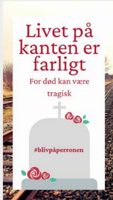
Billede 5: Story fra Instagram lavet af elev i 8. klasse til kampagnen Livet på kanten er farligt . Bliv på perronen fra DSB

Plakat og stories laves digitalt fx i www.canva.com eller Easel.ly på SkoleTube