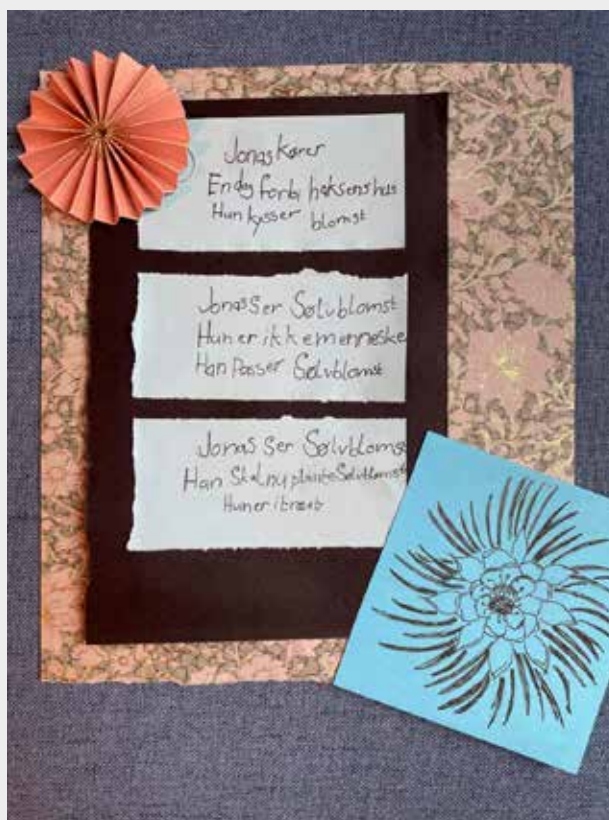
Billede 4: Haikudigt til Sølvblomst lavet af elev i 6. klasse

Derefter skal eleverne lave et haikudigt med tre strofer, der passer til bogens komposition. Første strofe skal beskrive bogens indledning, anden strofe bogens midte og tredje strofe bogens slutning.